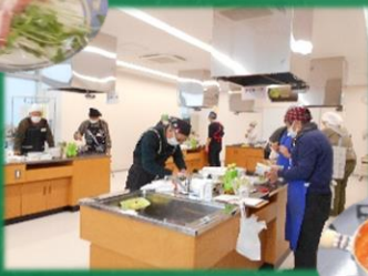
サバ缶のトマトビーンズ煮♪