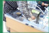
片付けもバッチリ!