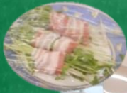
豆苗ともやしの 豚バラレンジ蒸♪