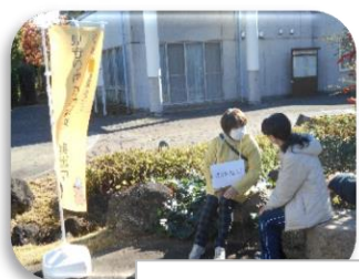
見守り声掛け訓練