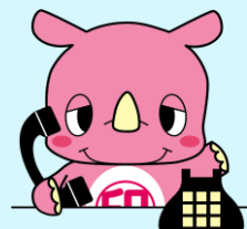
印西市マスコットキャラクター 「いんざい君」